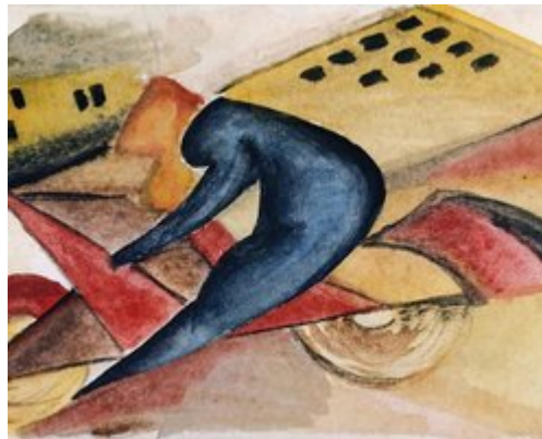
Carte Futuriste Ny utstilling på Vigeland-museet i samarbeid med det italienske kulturinstituttet i Oslo. 20. mars - 3. mai