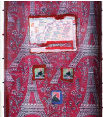
Paris Hilton: Fantasy and Simulacrum av Iké Udé - ny utstilling på Stenersenmuseet 19. mars - 10. mai