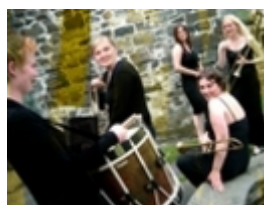
Norwegian Cornett & Sackbuts

Sommerutstillingen viser en bred presentasjon av Edvard Munchs mest kjente verker i maleri og grafikk. En stor del av Munchs mest kjente bilder har vært på utstilling i utlandet, men nå kan publikum igjen se etterspurte verk som Stemmen , Stoffveksling , Vampyr , Døden i sykeværelset , Fire piker i Åsgårdstrand , Selvportrett mellom klokken og sengen .