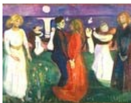
Livets dans, 1925, olje på lerret.

Få med deg en konsert i Vigeland-museets borggård i sommer!