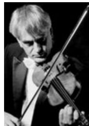
Arr. Ole Böhn. Klassisk og jazz.

Norsk skulpturbiennale 08 på Vigeland-museet 6. juni - 24. august